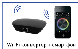
Wi-Fi конвертер + смартфон